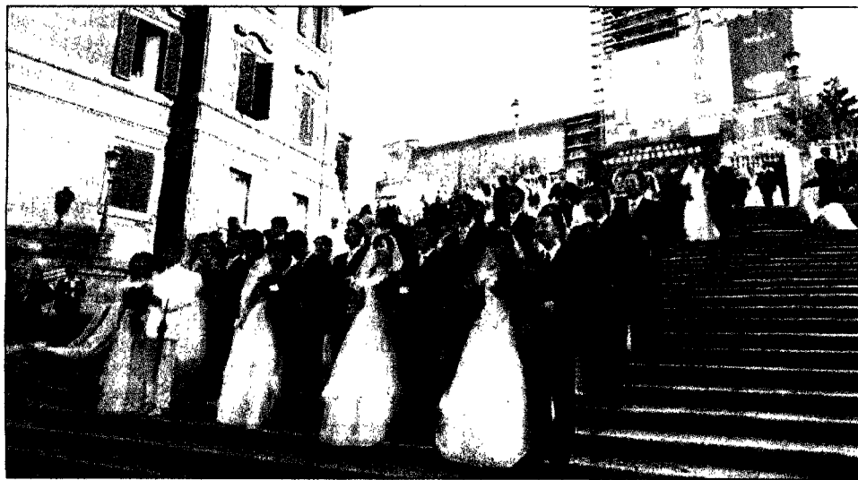
Il primo matrimonio di 50 coppie cinesi a Roma. In un "gemellaggio" con Pechino una delegazione della Regione incontra i tour operator e partono le prossime iniziative di scambio. E l'autore di "Sorgo rosso" Mo Yan ha filmato le meraviglie della capitale da mostrare in Cina Evangelisti all'interno

Oltre centomila presenze nel 2008. Matrimoni di gruppo e tour in Ferrari